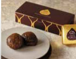
⑧<鎌倉紅谷>マロングラッセ 1箱・3個入……………【70箱限り】1,080円