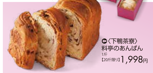
⑥<下鴨茶寮> 料亭のあんぱん 1斤 【20斤限り】1,998円