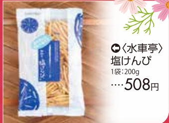
⑭<水車亭> 塩けんぴ 1袋・200g ……………508円