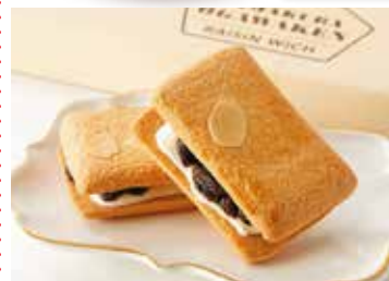
④<鎌倉小川軒> レーズンウイッチ 1箱・5個入 ……………【80箱限り】831円