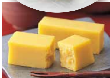
⑤<舟和本店> 芋ようかん5本詰 1箱・…【60箱限り】864円