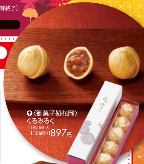
③<御菓子処花岡> くるみるく 1箱・6個入 【50箱限り】897円