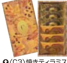
⑨<C3>焼きティラミス 焦がしキャラメル 1箱・6個入ミックス【40箱限り】1,296円