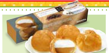
<ヒロタ> ⑩ウィンナーコーヒージュークリーム ⑪オリジナルシュークリーム (カスタード・チョコレート・ツインフレッシュ・ジャンマスカット) 1箱・各4個入……………【各20箱限り】各346円