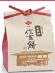
⑬<金精軒> 信玄餅 1袋・6個入 ……………1,361円