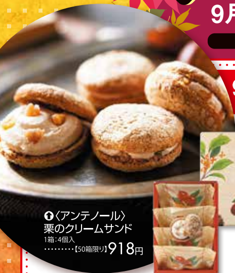
①<アンテノール> 栗のクリームサンド 1箱・4個入 ……………【50箱限り】918円