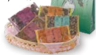
⑫<京つけもの 西利> 味の小さ袋 1袋・5点入(5種類×1) 1,080円