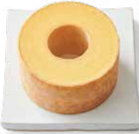
⑦<治一郎> 治一郎のパウムクーヘン 1個……………【120個限り】2,601円